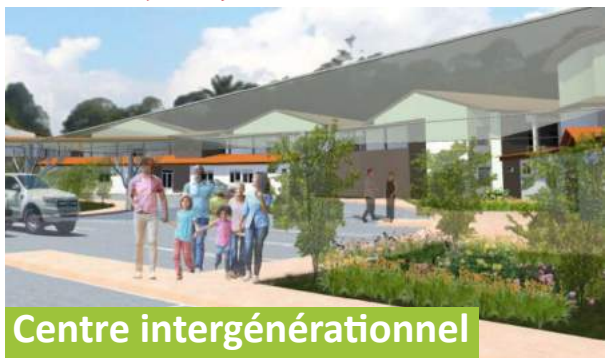
Centre intergénérationnel de Macouria

Pour faire face aux besoins en termes de logement et de prise en charge des personnes âgées en Guyane, un projet de construction d'un complexe intergénérationnel comprenant la première résidence seniors du département devrait être lancé dès le mois de novembre sur la commune de Macouria.